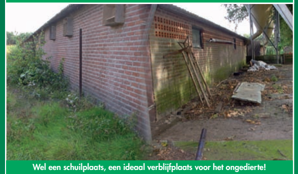
Wel een schuilplaats, een ideaal verblijfplaats voor het ongedierte!