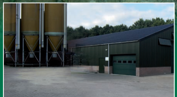
Geen schuilplaats voor het ongedierte, dus niet aantrekkelijk (pleinvrees)!

Dodelijke dosis bij eenmalige gifopname. De dood treedt in na 3-4 dagen.